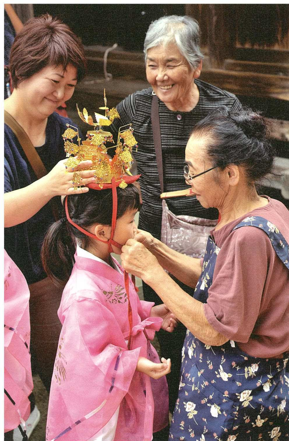
2016年巻・岩室温泉郷観光写真コンテスト 最優秀賞「ワァー可愛い」