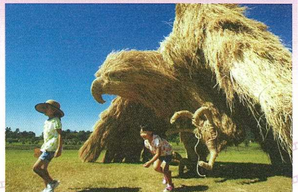
新潟市長賞「ピンチ!？」