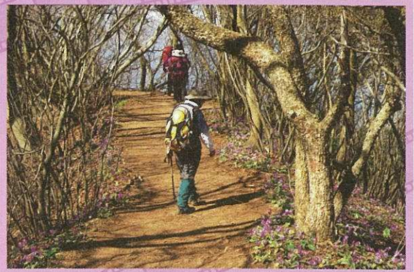
巻観光協会会長賞「カタクリの小径」