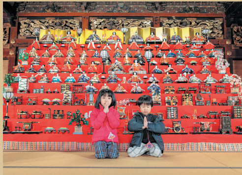
岩室温泉観光協会賞「祈りの時間」