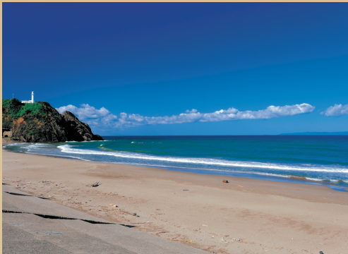
巻観光協会賞「秋晴れ」