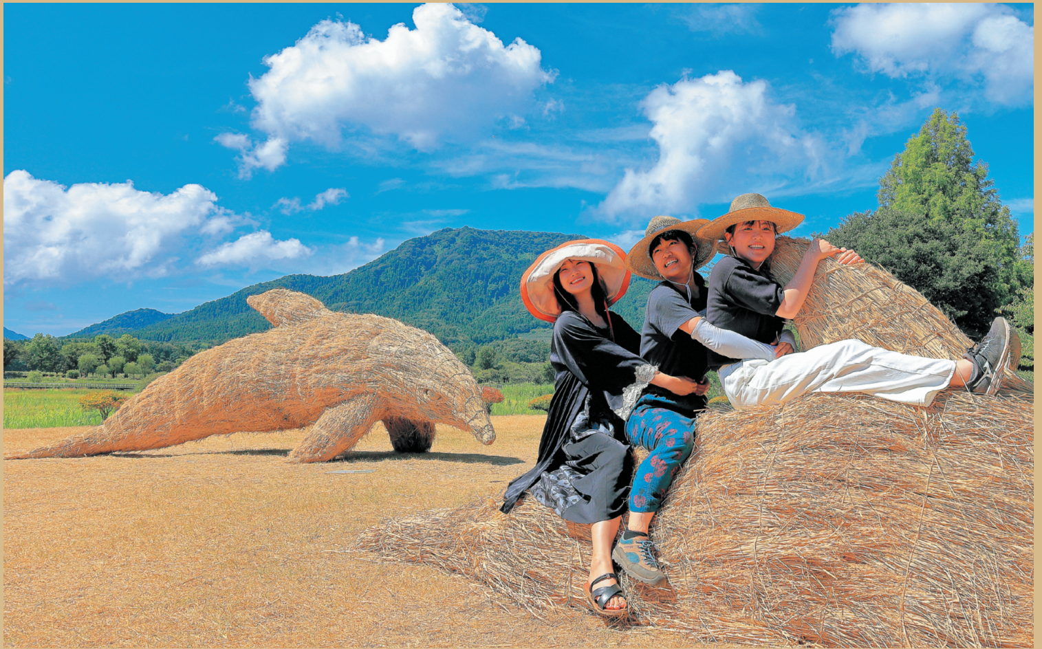
2023年巻・岩室温泉郷観光写真コンテスト 最優秀賞「越後の海」